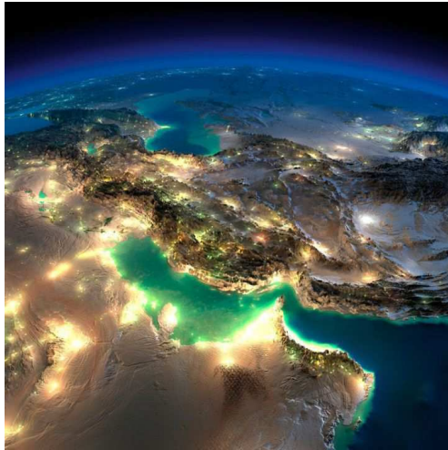
La terre vue d'en haut