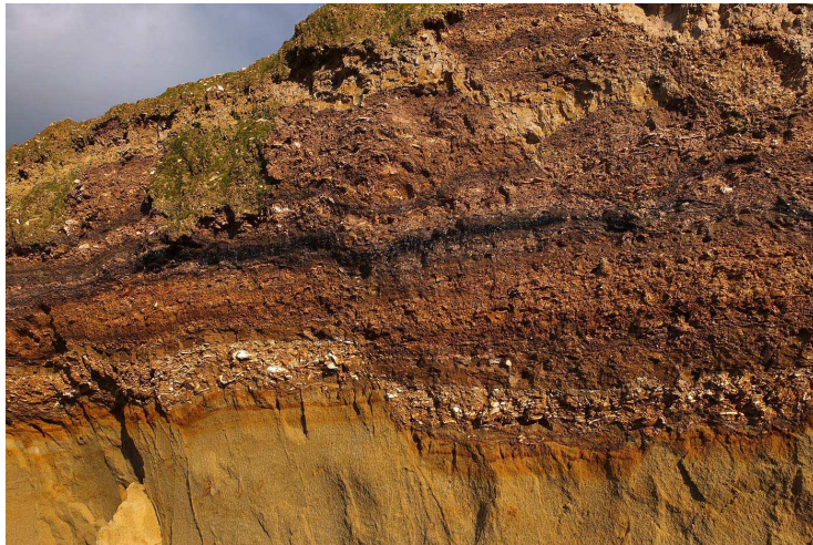
Stratigraphie ( les différentes couches d'un terrain...)